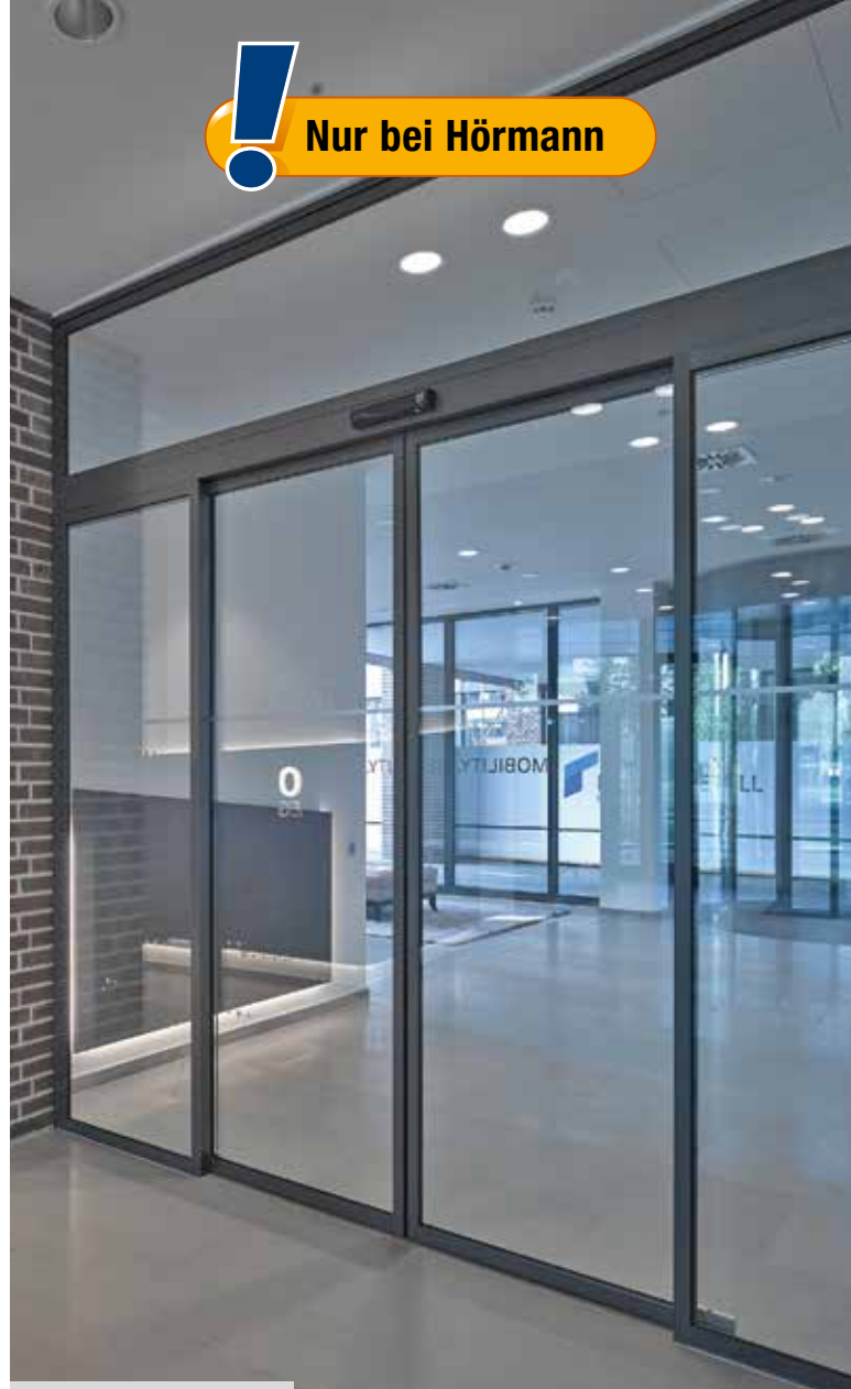
Delta D, Düsseldorf