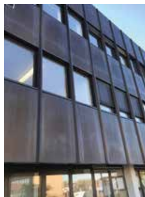
Bild 1: Ausgangszustand der Fassade.

Auf ein Beschichten der vorhandenen Schattenfugen konnte verzichtet werden, da diese nach dem Lackieren der Sichtflächen mit einer Silikonfuge versehen wurden. Es fand ausschließlich eine kantenumgreifende Überbeschichtung statt. Das Aufbringen der Grundierung und der Deckbeschichtung war nur bei trockener Witterung in einem Temperaturbereich von über 10 °C und einer Luftfeuchtigkeit < 60 % möglich. Durch eine gezielte Zugabe der Verdünnung konnte insbesondere bei höheren Tempera-