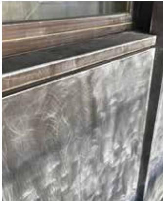
Bild 4: Die eloxierte Oberfläche wurde zur Haftungsverbesserung und Schmutzbeseitigung angeschliffen.